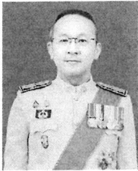
๑๗. นายสุรสีห์ กิตติมณฑล อดีตอธิบดีกรมฝนหลวงและการบินเกษตร และเลขาธิการสำนักงานทรัพยากรน้ำแห่งชาติ