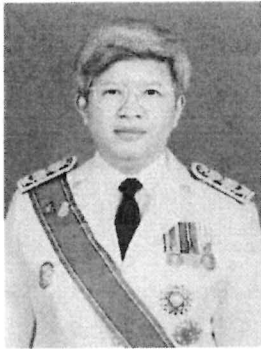
๕. นางสาวรีนวดี สุวรรณมงคล อดีตอธิบดีกรมคุมประพฤติ และอดีตอธิบดีกรมบังคับคดี