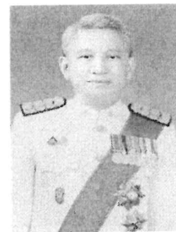
๑๐. นายยุทธพงษ์ อภิรัตน์รังษี อธิบดีอัยการ สำนักงานคดีทรัพย์สินทางปัญญา และการค้าระหว่างประเทศ สำนักงานอัยการสูงสุด